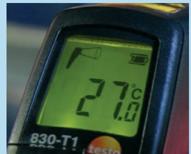
带背光显示器,易于读取