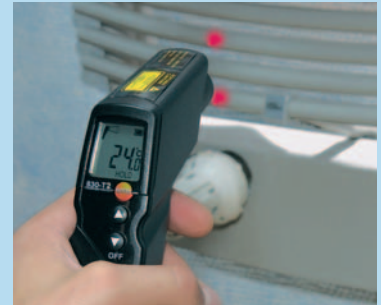
激光瞄准,精确可靠