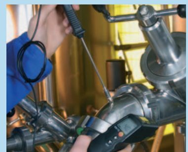
外接温度探头插口(testo 830-T2)